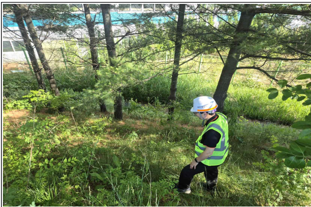
S-LINE 비탈면 점검