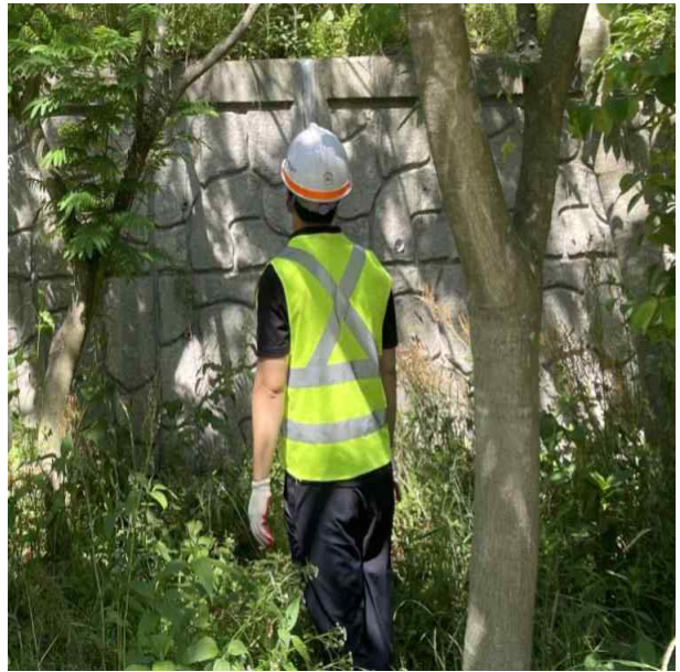
A-LINE 옹벽 점검