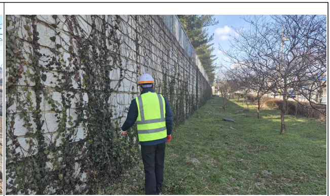
A-LINE 옹벽 점검