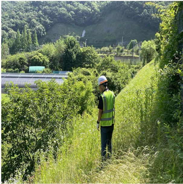
D-LINE 비탈면 점검