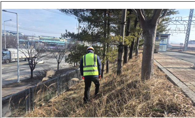
A-LINE 비탈면 점검