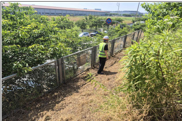
F-LINE 비탈면 점검