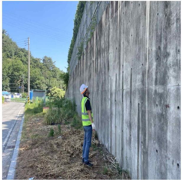
D-LINE 옹벽 점검