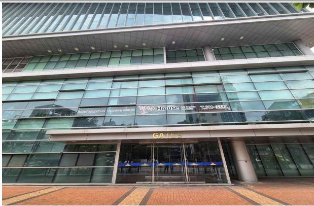
GATE 9 (도로쪽)