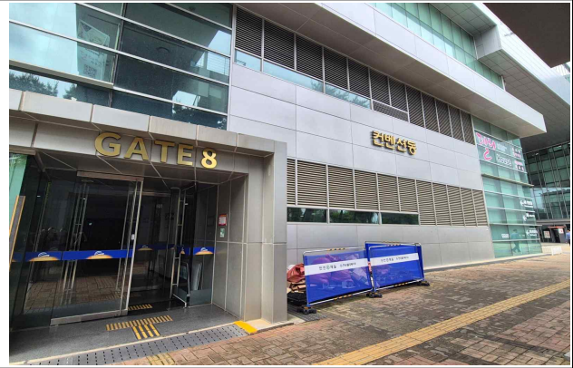
GATE 8 (주차장 옆)