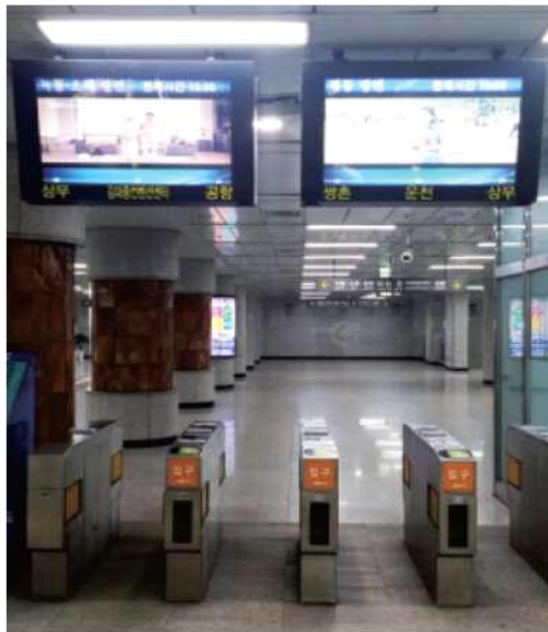
LCD행선안내게시기 설치 현황