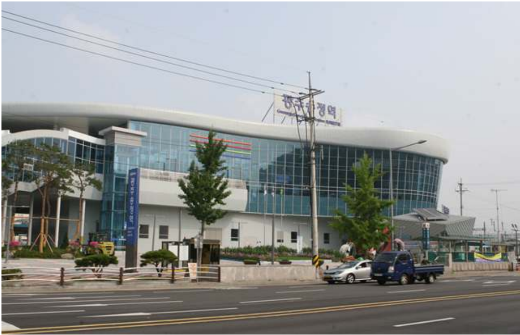
광주송정역 전경 사진3