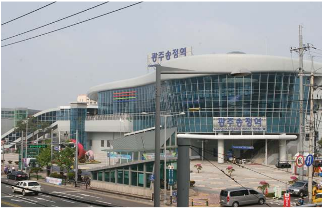
광주송정역 도시철도 출입구 사진3