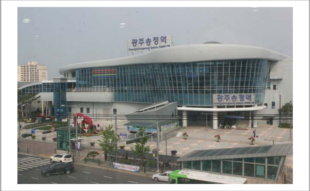
광주송정역 전경 사진1