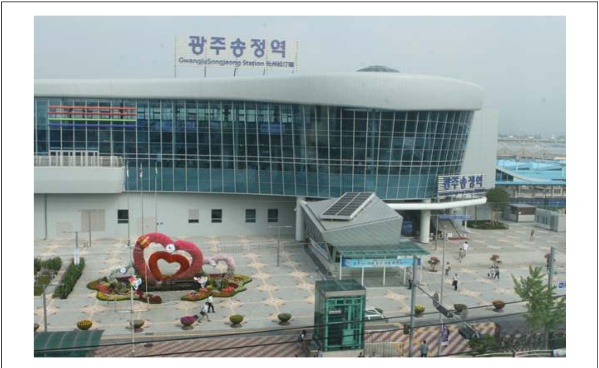
광주송정역 전경 사진2