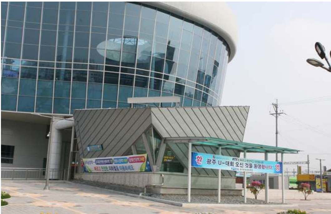
광주송정역 도시철도 출입구 사진1