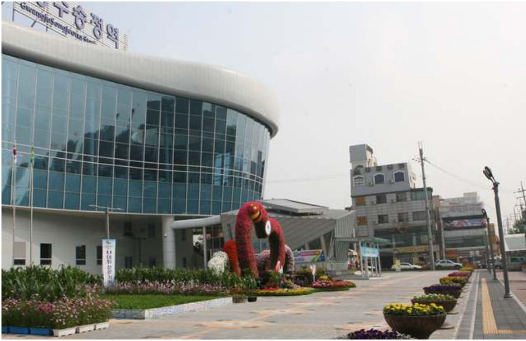
광주송정역 도시철도 출입구 사진2